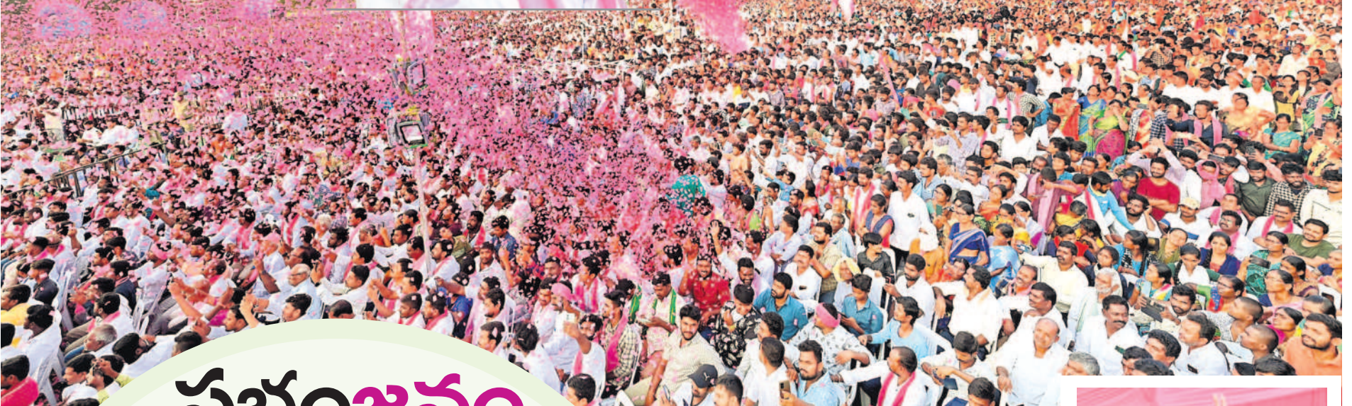
చేర్యాల ప్రజా ఆశీర్వాద సభకు హాజరైన అశేషజనం