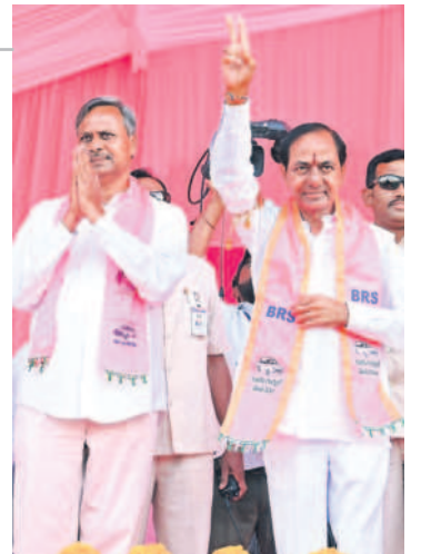
చేర్యాల ప్రజా ఆశీర్వాద సభలో అభివాదం చేస్తున్న సీఎం కేసీఆర్