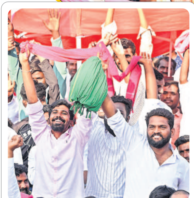
ఉరకలెత్తే ఉత్సాహం : సభలో అభిమానుల జోష్