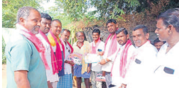
గుండాలు : వెల్లజాలలో ప్రచారం నిర్వహిస్తున్న బీఆర్ఎస్ నాయకులు