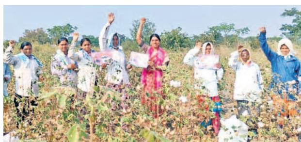
యాదగిరిగుట్ట: చొల్లెరులో ప్రచారం నిర్వహిస్తున్న జడ్పీటీసీ అనూరాధ