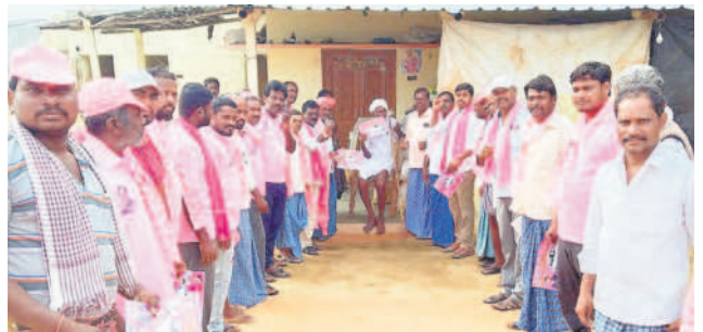
గుండాలు : సుద్దాలలో ఓటు అభ్యర్థిస్తున్న బీఆర్ఎస్ నాయకులు