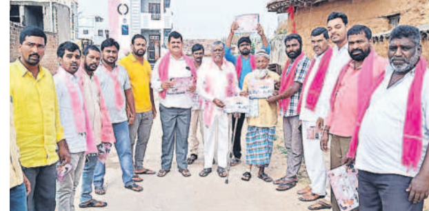
తుర్కపల్లి : మాదాపురంలో ప్రచారంలో పాల్గొన్న బీఆర్ఎస్ నాయకులు