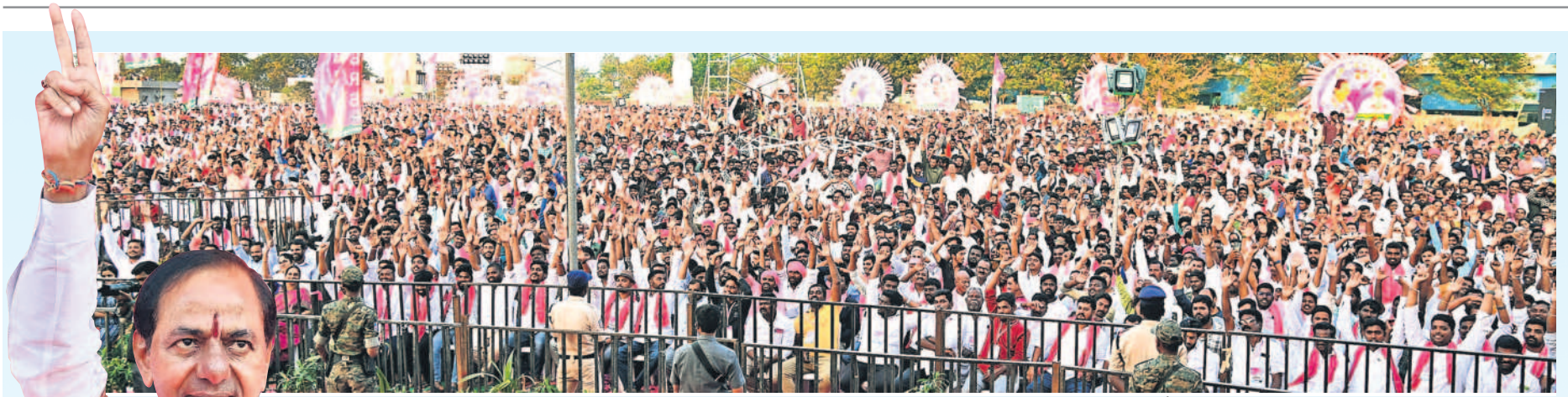
చేర్యాల ప్రజా ఆశీర్వాద సభకు పెద్ద ఎత్తున హాజరైన జనం, అభివాదం చేస్తున్న సీఎం కేసీఆర్