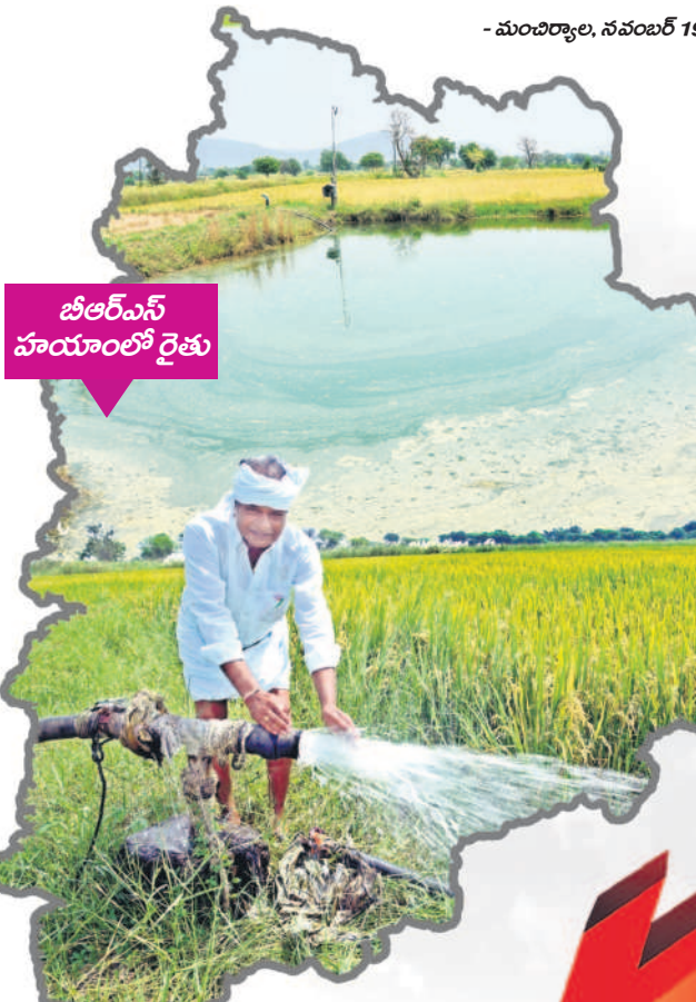
బీఆర్ఎస్ హయాంలో రైతు