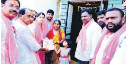
నిర్మల్ అర్బన్ : పట్టణంలో ప్రచారం చేస్తున్న మంత్రి ఇంద్రకర్ణ రెడ్డి

● మూడు గంటలు వద్దు.. 24 గంటల ఉచిత కరెంటు ముద్దంటున్న రైతులు ● ఎద్దు, ఎవుసం తెలువనోళ్లు ఆగం చేయాలని చూస్తున్నారని ఆగ్రహం ● భూగర్భ జలాలు అడుగంటి.. భూమి తడవడం కష్టమవుతోందని ఆవేదన