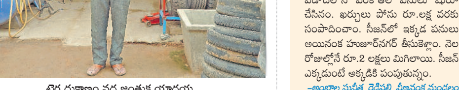
డ్రైవర్ దుకాణం వద్ద ఇంకంత యాదయ్య

మరో ముగ్గురికి ఉపాధి ఇస్తున్నా.. దళితబంధు నిధులతో సొంత గ్రామంలో వెల్లింగ్ షాప్ పెట్టుకున్నా. అంత కుటుంబం చిన్న మిషిన్స్ వెంట్రోవోని ఊరూరు తిరిగి పని చేసుకునేవాణ్ణి. ఇప్పుడు పెద్ద మిషిన్స్ సిస్టమ్ డ్రాక్టర్ డ్రాల్స్, కల్లివేటర్లు, కేక్ వీల్స్, పట్టర్స్, గ్రీన్ పనులు చేస్తున్నా. తెలంగాణలో వ్యవసాయం బాగు పడటంతో రైతుల నుంచి ఆర్డర్లు బాగా వస్తున్నాయి. నెలకు రూ.40 నుంచి రూ.50 వేల వరకు సంపాదిస్తున్నా. ఒకనాడు ఉపాధి కోసం వెతుక్కున్న నేను ఇప్పుడు ఇతరులకు ఉపాధి కల్పించడం గర్వంగా ఉంది. ఇంతకుముందు ఏ ప్రభుత్వం ఇలాంటి పథకాలను ప్రవేశపెట్టలేదు.