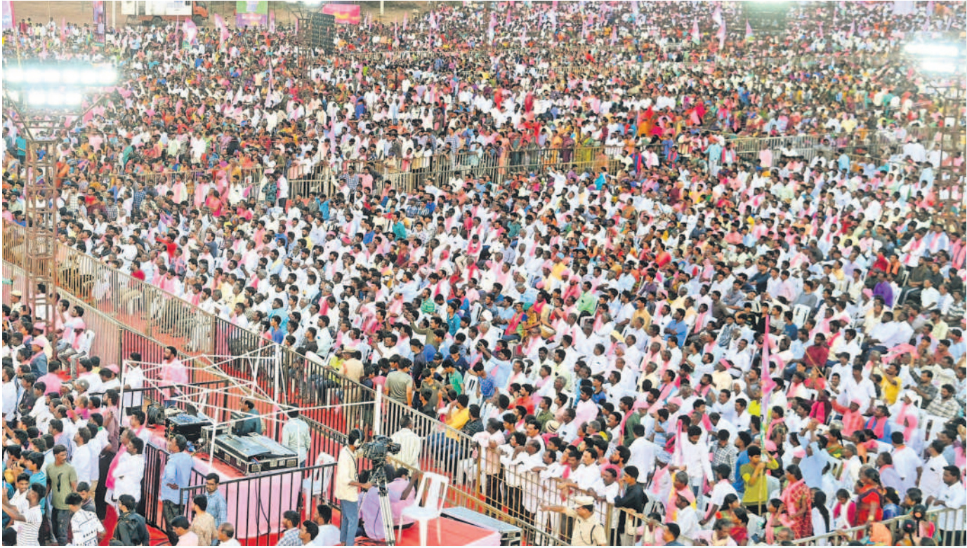
కల్వకుర్తి నియోజకవర్గం ప్రజా ఆశీర్వాద సభకు పెద్ద ఎత్తున హాజరైన జనం