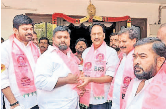
వెంకటగిరికి చెందిన యువకులు బీఆర్ఎస్లో చేరగా, వారికి గులాబీ కండువా కప్పి పార్టీలోకి ఆహ్వానిస్తున్న ఎమ్మెల్యే మాగంటి