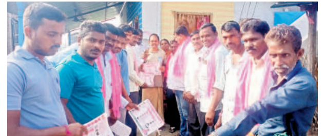
వెంకటాపూర్ : ప్రచారం నిర్వహిస్తున్న బీఆర్ఎస్ నాయకులు