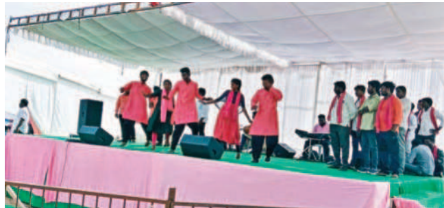
సభావేదికలో కళాకారులు నృత్యాలు చేస్తున్న దృశ్యం

మానవపాడు, నవంబర్ 19 : ఆలంపూర్ నియోజకవర్గంలో ఆదివారం నిర్వహించిన ప్రజా ఆశీర్వాద సభలో కళాకారులు తమ ఆటపాటలతో ఆల రించారు. ప్రజలు సభావేదిక చేరిన తర్వాత కళాకారులు ఏపూరి సోమన్న బృందం తెలంగాణ వచ్చిన బీఆర్ఎస్ ప్రభుత్వం చేసిన అభివృద్ధి పనులు, చేపట్టిన సంక్షేమ పథకాలను ఆట పాటలతో వివరించారు. అలాగే బీఆర్ఎస్ ప్రభుత్వం ప్రకటించిన ఎన్నికల మ్యానిఫెస్టోను ప్రజలకు అర్థమయ్యేలా వివరించారు. కళాకారుల ఆటపాటలు అక్కడి వచ్చిన ప్రజలను మంత్ర ముగ్ధులను చేశాయి. కాలలు కేరింతలతో సభా ప్రాంగణం మార్చి గింది.