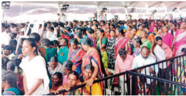
సీఎం ప్రసంగంలో కాలలు వేస్తున్న ప్రజలు