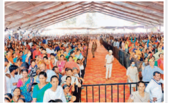
ప్రజా ఆశీర్వాద సభకు హాజరైన జననమూహం

అయిజ రూరల్, నవంబర్ 19 : వడ్డేపల్లి మండలం శాంతినగర్ లో ఆదివారం నిర్వహించిన ప్రజా ఆశీర్వాద సభకు నియోజకవర్గంలోని ఆయా గ్రామాల నుంచి ప్రజలు, కార్యకర్తలు, అధిక సంఖ్యలో తరలివచ్చారు. దీంతో సభ ప్రాంగణం అంతా ఆశేష జనవాహినితో కిక్కిరిసిపోయింది. సీఎం కేసీఆర్ ప్రసంగం ప్రసంగాలతో సభా ప్రాంగణం అంతా కేరింతలు, కాలలతో మార్చి గింది. ఎక్కడ చూసినా గులాబీ జెండాలు, ప్లెక్సీలతో కళకళలాడాయి.