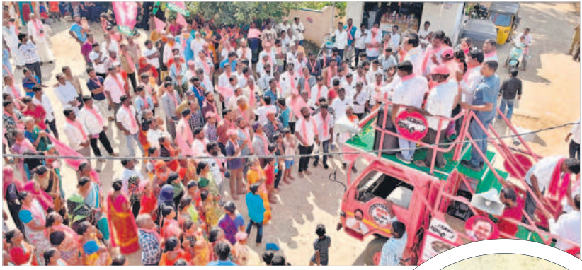
మంత్రికి ఘనస్వాగతం పలుకుతున్న దివిటిపల్లి గ్రామస్థులు