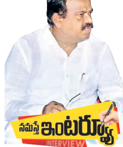
కమ్యూన్ పత్రి, నవంబర్ 19: