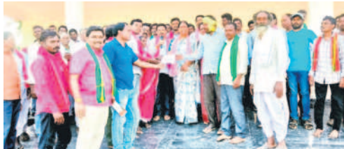
ఆసిఫాబాద్ టోన్ : బీఆర్ఎస్ పార్టీకి మద్దతు తెలుపుతూ అంగీకార పత్రాన్ని కోవ లక్ష్మికి అందజేస్తున్న నాయక్ పోడి సంఘం నాయకులు