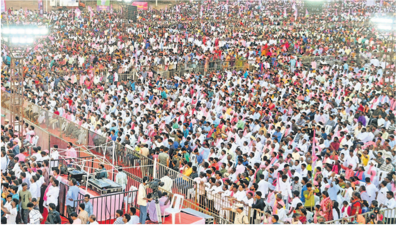
కల్వకుర్తి నియోజకవర్గం ప్రజా ఆశీర్వాద సభకు పెద్ద ఎత్తున హాజరైన జనం