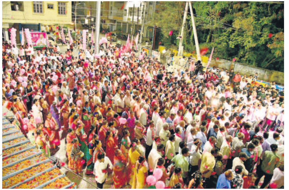
37వ డివిజన్లో భారీగా హాజరైన ప్రజలు

తిమ్మాపూర్: ఎల్ఎండిలోని శ్రీచైతన్య కళాశాలలో సభా ప్రాంగణం