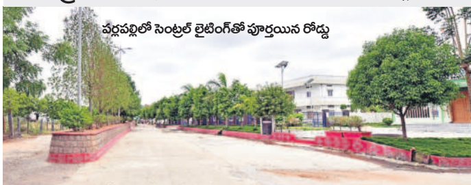
పర్లపల్లిలో సెంట్రల్ లైటింగ్తో పూర్తయిన రోడ్డు

స్వరాష్ట్రంలో ఆదర్శంగా మానకొండూర్ నియోజకవర్గం