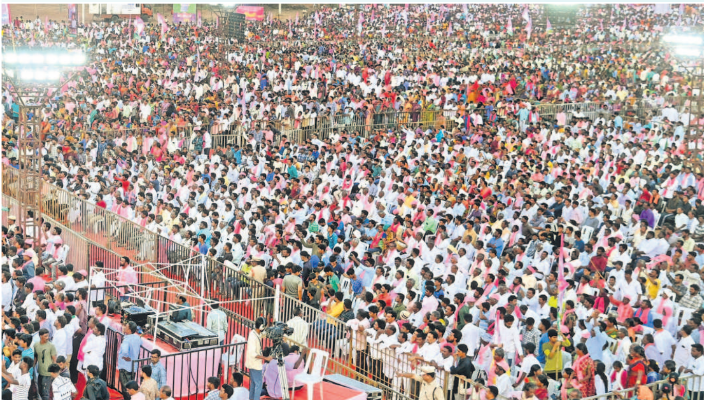
కల్వకుర్తి నియోజకవర్గం ప్రజా ఆశీర్వాద సభకు పెద్ద ఎత్తున హాజరైన జనం