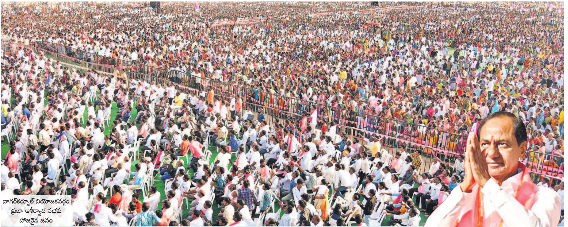
నాగర్ కర్నూల్ నియోజకవర్గం ప్రజా ఆశీర్వాద సభకు హాజరైన జనం