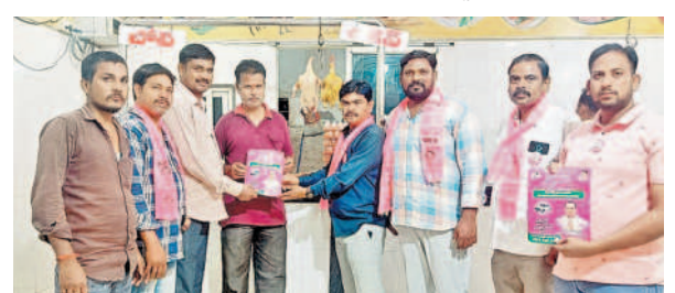
కిసర మెయిన్ రోడ్ లో షావ్ వద్ద ప్రచారం చేస్తున్న బీఆర్ఎస్ నేతలు