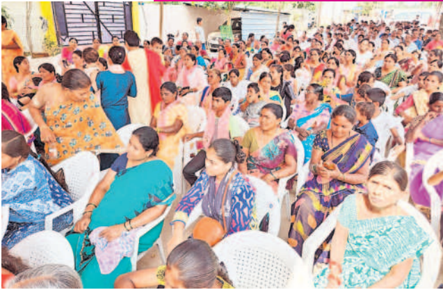
పీర్షాదిగూడలో ఆత్మీయ సమ్మేళనంలో పాల్గొన్న స్థానికులు, నాయకులు, పార్టీ శ్రేణులు