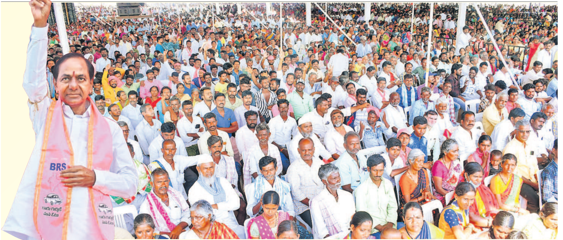
అలంపూర్ ప్రజా ఆశీర్వాద సభకు పెద్ద ఎత్తున హాజరైన జనం