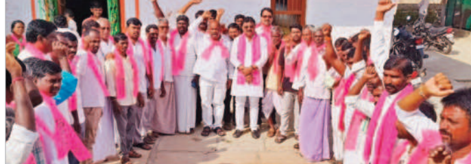
దేవరకల్: బీఆర్ఎస్ లో చేరుతున్న ఆయా పార్టీల నాయకులు