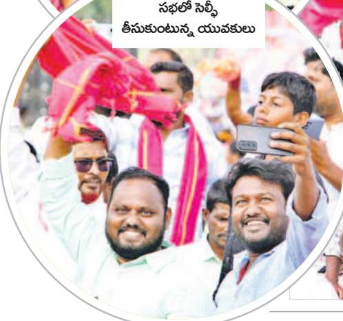
సభలో సెల్ఫీ తీసుకుంటున్న యువకులు