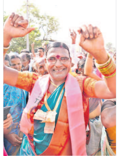
కొల్లాపూర్లో నిర్వహించిన సభలో కళాకారుల పాటలకు డ్యాన్స్ చేస్తున్న ట్రాన్స్ జెండర్