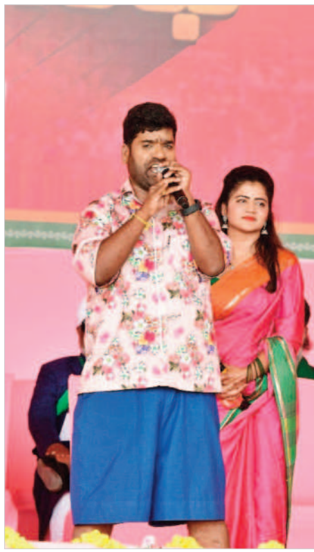
పాట పాడుతున్న బిత్తిరి సత్తి

సీఎం కేసీఆర్ ప్రసంగిస్తుండగా మధ్య అంటూ వినడాలు చేశారు. కళాకారుల మధ్యలో యువకులు మహిళలు పెద్దవత్తున జై తెలంగాణ అంటూ జై కేసీఆర్ అంటూ వినడాలు చేశారు. కళాకారుల ఆటపాటలు ప్రజలను ఎంతగానో ఆకట్టుకున్నాయి.