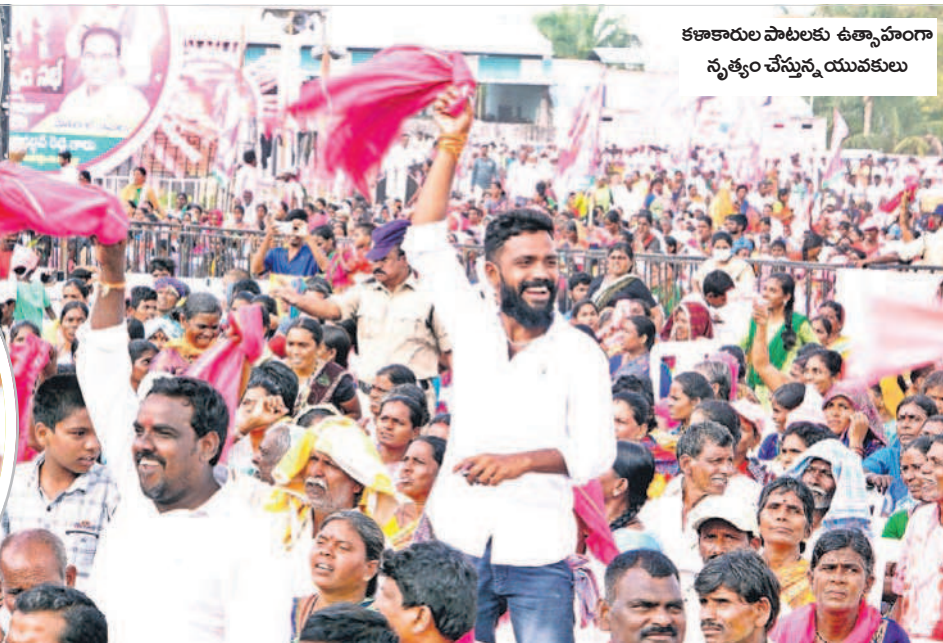
కళాకారుల పాటలకు ఉత్సాహంగా నృత్యం చేస్తున్న యువకులు