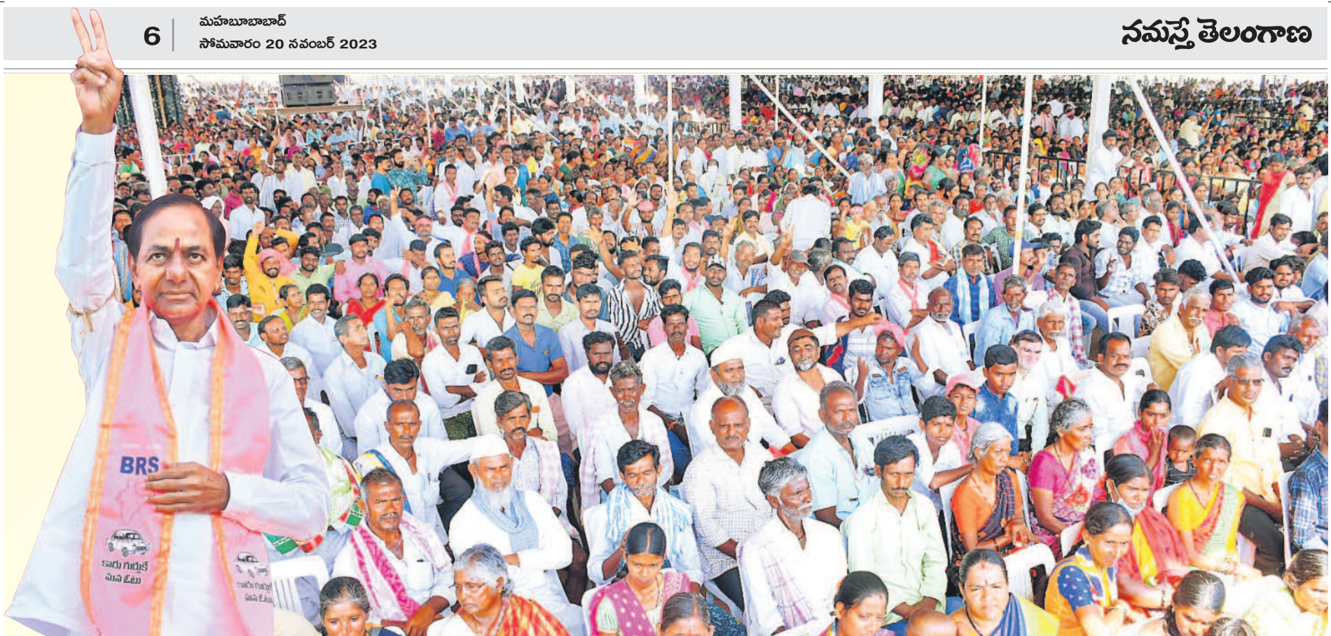
అలంపూర్ ప్రజా ఆశీర్వాద సభకు పెద్ద ఎత్తున హాజరైన జనం