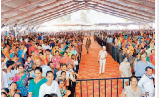
ప్రజా ఆశీర్వాద సభకు హాజరైన జననమూహం

అయిజ రూరల్, నవంబర్ 19 : వడ్డేపల్లి మండలం శాంతినగర్ లో ఆదివారం నిర్వహించిన ప్రజా ఆశీర్వాద సభకు నియోజకవర్గంలోని ఆయా గ్రామాల నుంచి ప్రజలు, కార్యకర్తలు, అధిక సంఖ్యలో తరలివచ్చారు. దీంతో సభ ప్రాంగణం అంతా ఆశేష జనవాహినితో కిక్కిరిసిపోయింది. సీఎం కేసీఆర్ ప్రసంగం ప్రసంగాలతో సభ ప్రాంగణం అంతా కేలంతలు, కాలలతో మార్చి గింది. ఎక్కడ చూసినా గులాబీ జెండాలు, ప్లాకీలతో కళకళలాడాయి.