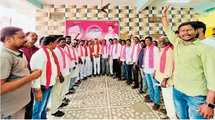
ఎమ్మెల్యే బీరం సమక్షంలో బీఆర్ఎస్లో చేరిన వివిధ మండలాల కాంగ్రెస్ మైనార్టీ నాయకులు

• గులాబీగూటికి చేరిన వివిధ మండలాల కాంగ్రెస్ మైనార్టీ నాయకులు