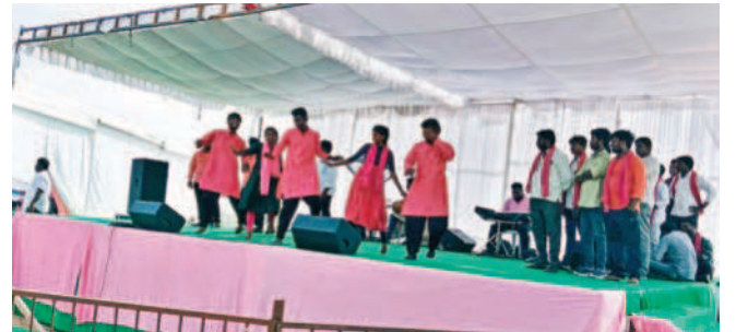
సభావేదికలో కళాకారులు నృత్యాలు చేస్తున్న దృశ్యం

మానవపాడు, నవంబర్ 19 : ఆలంపూర్ నియోజకవర్గంలో ఆదివారం నిర్వహించిన ప్రజా ఆశీర్వాద సభలో కళాకారులు తమ ఆటపాటలతో ఆల రించారు. ప్రజలు సభావేదిక చేరిన తర్వాత కళాకారులు ఏపూరి సోమన్న బృందం తెలంగాణ వచ్చిన బీఆర్ఎస్ ప్రభుత్వం చేసిన అభివృద్ధి పనులు, చేపట్టిన సంక్షేమ పథకాలను ఆట పాటలతో వివరించారు. అలాగే బీఆర్ఎస్ ప్రభుత్వం ప్రకటించిన ఎన్నికల మ్యానిఫెస్టోను ప్రజలకు అర్థమయ్యేలా వివరించారు. కళాకారుల ఆటపాటలు అక్కడి వచ్చిన ప్రజలను మంత్ర మగ్గులను చేశాయి. కాలలు కేరింతలతో సభ ప్రాంగణం మార్చి గింది.