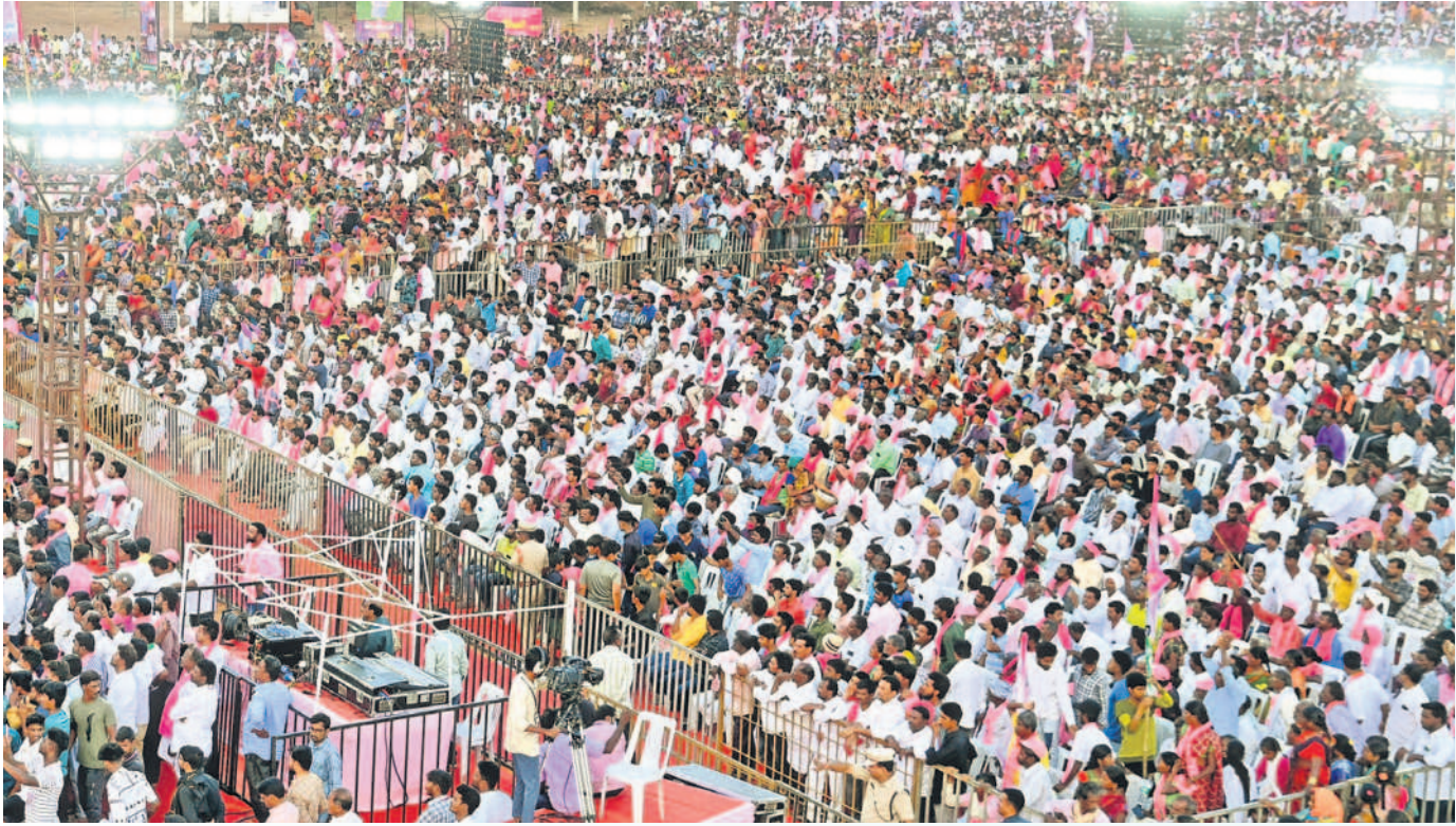
కల్వకుర్తి నియోజకవర్గం ప్రజా ఆశీర్వాద సభకు పెద్ద ఎత్తున హాజరైన జనం