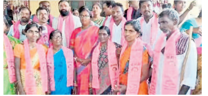
మంగపేట : బీఆర్ఎస్ లో చేరిన వారితో ఎమ్మెల్యే అభ్యర్థి నాగజ్యోతి