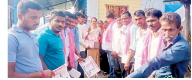
వెంకటాచార్య : ప్రచారం నిర్వహిస్తున్న బీఆర్ఎస్ నాయకులు