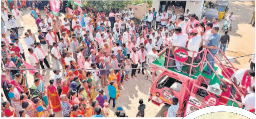
మంత్రికి ఘన స్వాగతం పలుకుతున్న దివిటిపల్లి గ్రామస్థులు