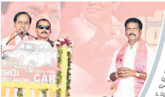
నాగర్ కర్నూల్ లో ప్రసంగిస్తున్న సీఎం కేసీఆర్, పక్కన ఎమ్మెల్యే అభ్యర్థి మర్రి

నాగర్ కర్నూల్ (నమస్తే తెలంగాణ), నవంబర్ 19 : సీఎం కేసీఆర్ నాకు దైవసమానులు. కం దనూలును సస్యశ్యామలం చేసి నన్ను ఆశీర్వ దించడానికి ఇక్కడికి రావడం చాలా సంతో షం. కందనూలు ఒకప్పుడు కరువు జిల్లా. 2014లో బీఆర్ఎస్ అధికారంలోకి వచ్చాక ఎంజీకేఎల్ఐ నీళ్లు తీసుకొచ్చాం. ప్రత్యేక జిల్లా, మెడికల్ కళాశాల ఏర్పాటు చేసుకున్నాం. గతంలో ఇచ్చినమాట ప్రకారం మార్కుండేయ లిప్టు ప్రారంభమైంది. ఐదు తండాలు, 17 గిరి జన తండాల్లో 8వేల ఎకరాలకు నీళ్లు ఇస్తుండ టంతో నా జన్మ ధన్యమైంది. తెలంగాణ, కంద నూలుపై సీఎం కేసీఆర్ కు ఉన్న ప్రేమ చెప్పలేనిది. నన్ను మూడోసారి బీఆర్ఎస్ అభ్యర్థిగా ప్రజల మధ్య నిలబె ట్టారు. నేను ఎన్నో సేవా కార్యక్రమాలు చేస్తున్నా. జీవితం ఉన్నంత కాలం ప్రజల్లోనే ఉంటాను. నా చర్చాన్ని వదిలి ప్రజలకు చెప్పేటటువంటి కుట్టి స్టూనే సేవ చేస్తాను. రైతుబిడ్డగా, కూలీ బిడ్డగా ప్రజల ఆశీర్వాదంతో ఎంతో సేవచేశా. కంద నూలుకు