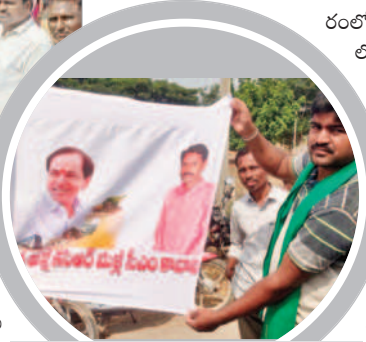
అన్న కేసీఆర్ సీఎం కావాలని వాహనానికి కట్టిన జెండాను చూపెడుతున్న కర్ణాటక రైతు

కర్ణాటక రాష్ట్రంలోని దేవనూగూర్ పరిసర గ్రామాల నుంచి తెలంగాణలోకి వస్తున్న రైతులపై మక్తల్ నియోజకవర్గానికి చెందిన కాంగ్రెస్ నాయకులు జాలు ప్రదర్శించారు. రైతుల వాహన ర్యాలీకి అడుగుడుగునా ఆటంకం సృష్టించారు. కృష్ణ మండలంలోని ట్రెకోట్ల, మాగనూర్ మండ