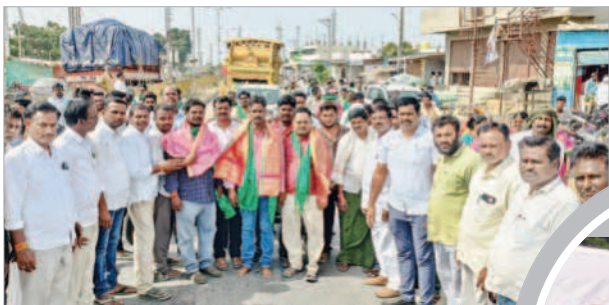
కర్ణాటక రైతులకు ఘన స్వాగతం పలుకుతున్న బీఆర్ఎస్ నాయకులు