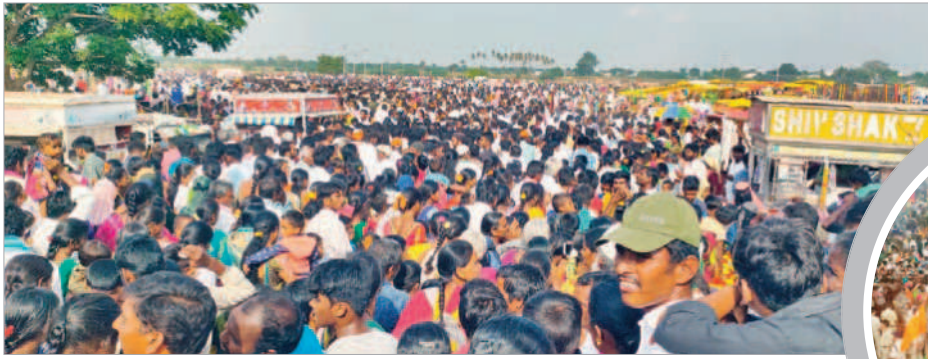
కురుమూర్తి స్వామి ఉద్దాల ఊరేగింపులో పాల్గొన్న భక్తులు