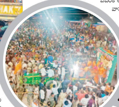
కురుమూర్తి స్వామి ఉద్దాలకు మొక్కుతున్న భక్తులు

వాయితీ. అందుకే భక్తులు ఎవరి స్థాయిని బట్టి వారు బైక్లు, ఆటోలు, కార్లు, జీపులు, ఎద్దుల బండ్లు, బస్సులు, గూడ్స్ వాహనాలు, ఇలా చెప్పుకుంటూ పోతే ఎవరికి అందుబాటులో ఉన్న వాహనాలతో నలుమూలల