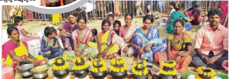
కురుమూర్తి స్వామికి దాసంగాలను సమర్పిస్తున్న భక్తులు