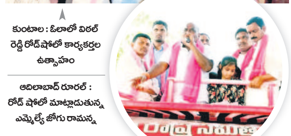
కుంటాల : ఓలాలో విరల్ రెడ్డి రోడ్ షోలో కార్యక్రమం ఉత్సాహం