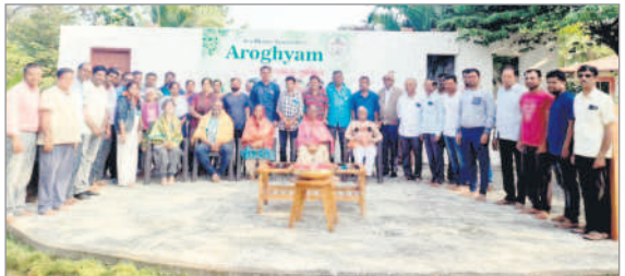
ప్రాన్స్ దేశస్థులని సన్మానిస్తున్న వైద్యులు