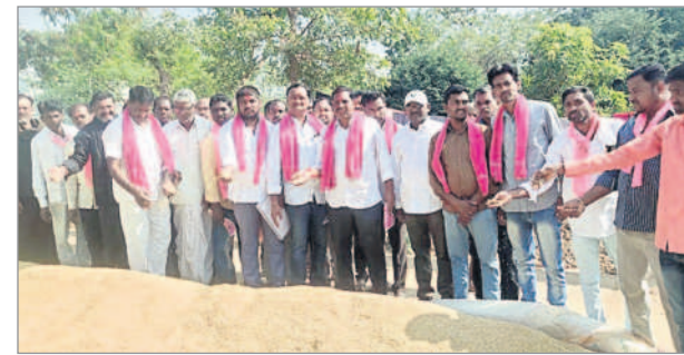
బైంసా టాన్ : వడ్లను పరిశీలిస్తున్న నాయకులు