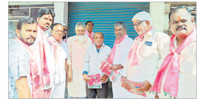
బైంసా : ఓటు అభ్యర్థిస్తున్న బీఆర్ఎస్ నాయకులు