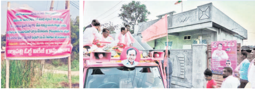
జిల్లాపల్లి (ఓల్డ్ విలేజ్)లో ఏర్పాటు చేసిన ఫైక్సీ