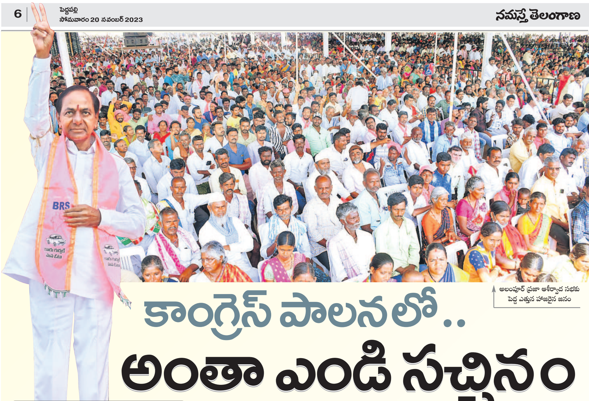
అలంపూర్ ప్రజా ఆశీర్వాద సభకు పెద్ద ఎత్తున హాజరైన జనం