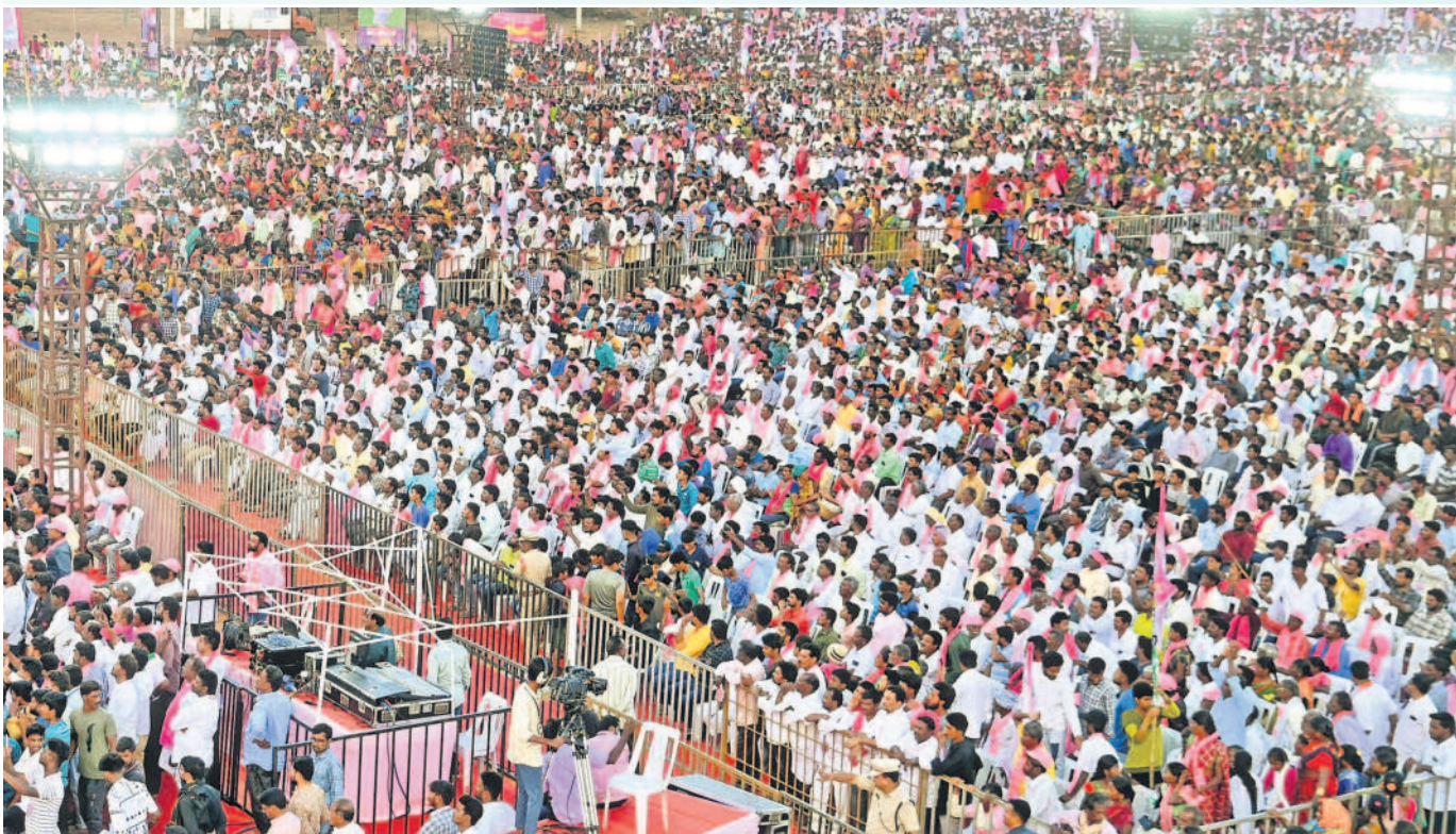
కల్వకుర్తి నియోజకవర్గం ప్రజా ఆశీర్వాద సభకు పెద్ద ఎత్తున హాజరైన జనం