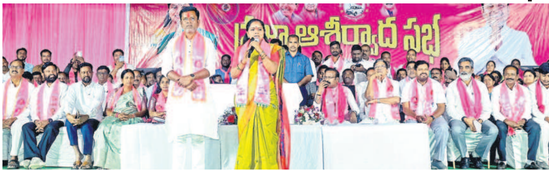
రామగిరి ప్రజా ఆశీర్వాద సభలో మాట్లాడుతున్న ఎమ్మెల్యే కల్వకుంట్ల కవిత, చిత్రంలో ఎమ్మెల్యే అభ్యర్థి పుట్ట మధూకర్, పెద్దపల్లి ఎంపీ వేంకటేశ్ నేతకాని