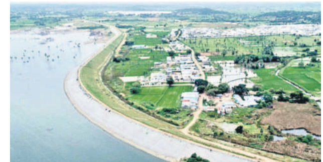
ఇల్లంతకుంట : అనంతగిరి ప్రాజెక్టు, చిత్తంలో అనంతగిరి పోచమ్మ తల్లి ఆలయ వ్యా