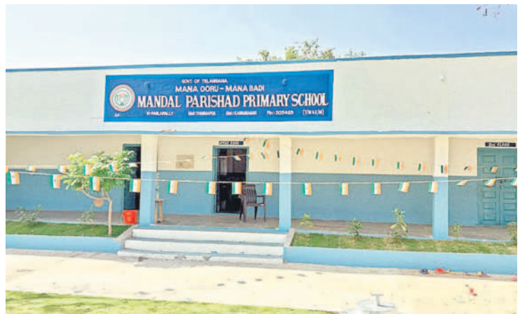
తిమ్మాపూర్ మండలం పల్లపల్లిలో అద్భుతంగా మారిన ప్రాథమిక పాఠశాల