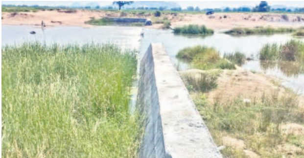
శంకరపట్నం మండలంలోని అర్కండ్ల శివారులోని వాగులో నిల్వించిన చెక్ డ్యాం

ఒకప్పుడు నీళ్లంటే ఎరుగని ఈ ప్రాంతంలో ఇప్పుడు జలసిరి ఉట్టిపడుతున్నది. కాశేశ్వరం ప్రాజెక్టు నిర్మాణంలో భాగంగా ఇల్లంతకుంట మండలంలో ₹2,900 కోట్లతో నిర్మించిన అనంతగిరి ప్రాజెక్టుతో ఇల్లంతకుంట, బెజ్జంకి, గన్నేరువరం మండలాలూ సస్యశ్యామలంగా మారాయి. ఇప్పుడు పచ్చని పంటలతో కళకళలాడుతున్నాయి. నాడు వానకాలంలో సైతం నీళ్లంటే ఎరుగని ఈ ప్రాంతం చెరువులు, కుంటలు ఇప్పుడు నిండు వేగువీలో కూడా మత్తళ్లు దుంకుతున్నాయి. కాశేశ్వరం నీళ్లతో పుష్కలమైన పంటలు పండుతున్నాయి. ఎస్సారెస్సీ పరిధిలోకిరాని తిమ్మాపూర్, మానకొండూర్ మండలాలకు ఎమ్మెల్యే రసమయి బాలకిషన్ కాలువలు తవ్వించడంతో జలాల పరుగులు తీస్తున్నాయి. అనంతగిరి ప్రాజెక్టుకు ఆనుకొని ₹2,700 కోట్ల భారీ వ్యయంతో తిమ్మాపూర్ సర్వీసాలను నిర్మించారు. ఇది ఆసియాలోనే అతిపెద్దది. 62 మీటర్ల ఎత్తు, 95 మీటర్ల లోతుతో ఉంటుంది. కాశేశ్వరం ప్రాజెక్టు నుంచి ఎగువకు ఈ సర్వీసాల్ ద్వారానే ఎత్తిపోస్తారు. దీని నుంచే అనంతగిరి ప్రాజెక్టుకు కాశేశ్వరం నీరు వెళ్తుంది. రాజన్న సిరిసిల్ల జిల్లాలోని మిడ్ మానేరు జలాశయం నుంచి ₹4 వేల కోట్ల