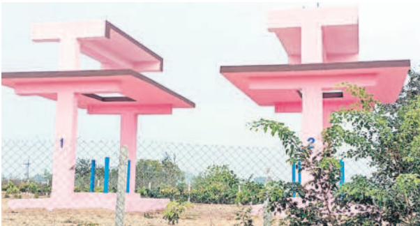
మానకొండూర్ మండలం ముంజంపల్లి గ్రామంలోని శ్మశానవాటిక