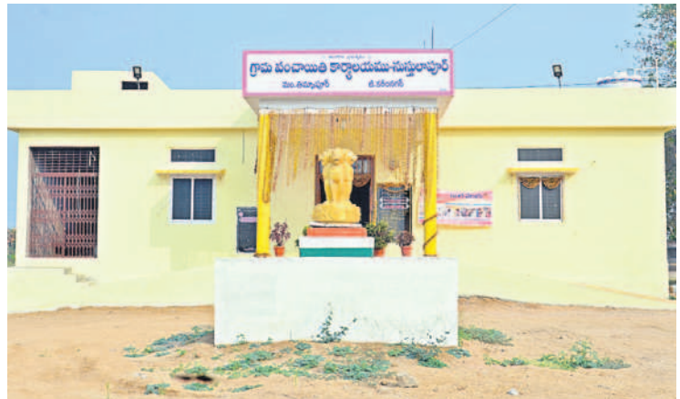
తిమ్మాపూర్ మండలం నుస్సులాపూర్ గ్రామ పంచాయతీ భవనం