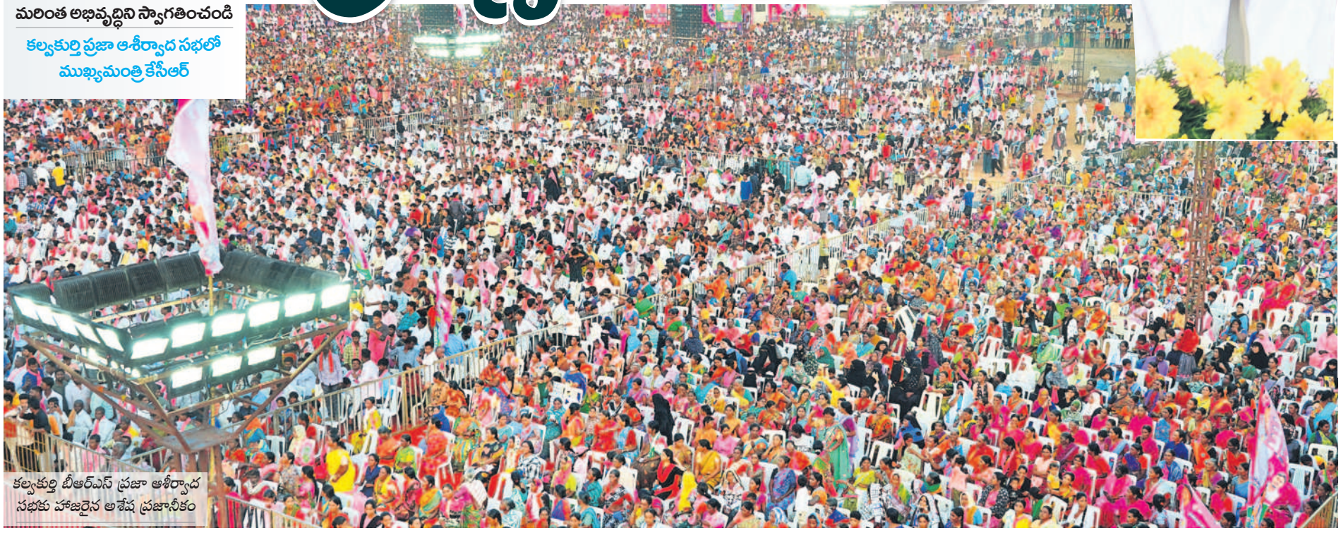
కల్వకుర్తి బీఆర్ఎస్ ప్రజా ఆశీర్వాద సభకు హాజరైన అశేష ప్రజానీకం