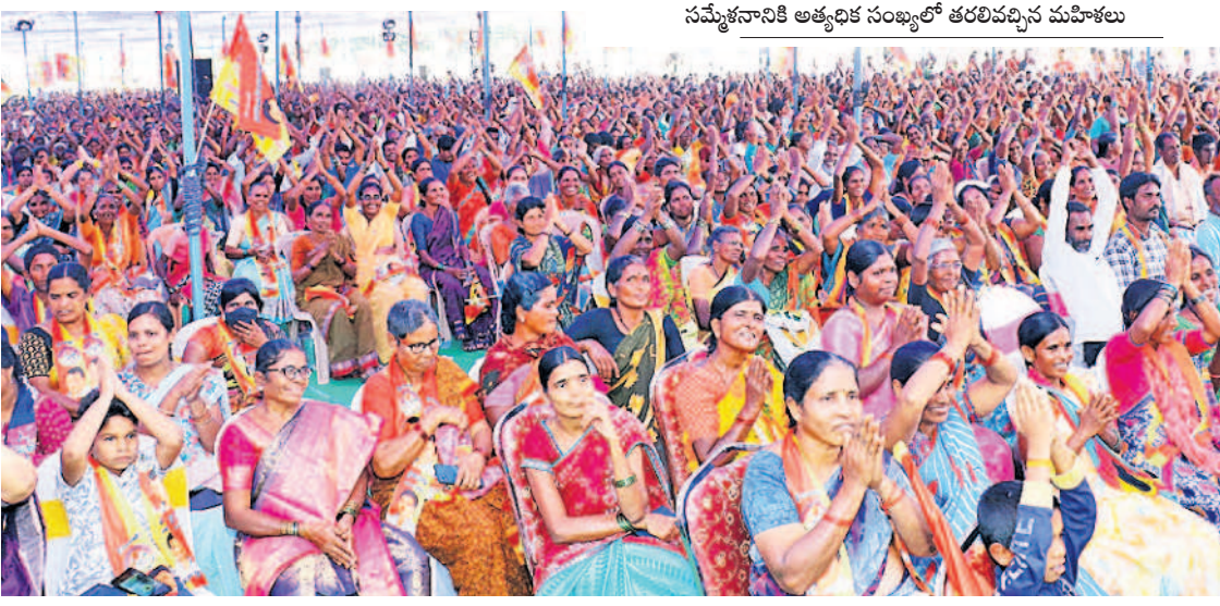
సమ్మేళనానికి అత్యధిక సంఖ్యలో తరలివచ్చిన మహిళలు

కాంగ్రెస్ అధిష్టానం బీసీలకు అన్యాయం చేసిందన్నారు. రేపంత్ రెడ్డి టికెట్లను అమ్ముకోవడంతో వెనుకబడిన కులాల వారికి మోసం జరిగిందని.. అందుకే రేపంత్ రెడ్డికి ఈ ఎన్నికల్లో సరైన గుణపాఠం చెప్పాలన్నారు. 70 ఏండ్లుగా ఏమీ చేయని కాంగ్రెస్, బీజేపీలు ఇప్పుడు బీసీలకు మేలు చేస్తామని చెప్పడం విడ్డూరంగా ఉంద