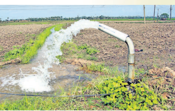
వ్యవసాయానికి 24 గంటల పూర్తి ఉచిత విద్యుత్

సిద్దిపేట, నవంబర్ 19 (నవంబర్ తెలంగాణ ప్రతినిధి): తెలంగాణ రాష్ట్రం ఏర్పడిన తర్వాత సీఎం కేసీఆర్ కరెంటు పై ప్రత్యేక దృష్టి సారించి విద్యుత్ కష్టాలు తీర్చారు. రైతులకు నిరంతరాయంగా విద్యుత్ కనెక్షన్లు అందిస్తున్నారు. 24 గంటల పాటు నాణ్యమైన కరెంటు ఇవ్వడంతో రైతులు ఖుషి ఖుషిగా పంటలు పండిస్తున్నారు. రాత్రి పూట బావుల కాడికి పోవుడు తప్పింది. తెలంగాణ రాష్ట్రం ఏర్పడిన నాటి నుంచి ఈ తొమ్మిదేండ్లలో విద్యుత్ రంగంలో సమూల మార్పులు వచ్చాయి. ఇప్పటి వరకు సిద్దిపేట జిల్లాలో ఒక విద్యుత్ మీదనే రాష్ట్ర ప్రభుత్వం రూ. 4,104.08 కోట్లు ఖర్చు చేసింది. జిల్లాలో అన్ని రకాల విద్యుత్ కనెక్షన్లు