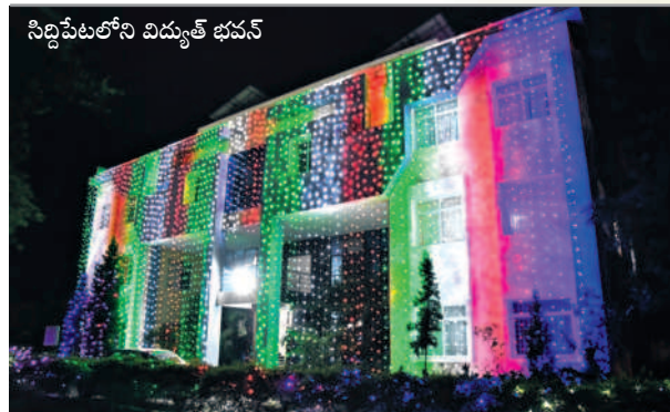
సిద్దిపేటలో ఎస్ఈ కార్యాలయం.

రైతాంగానికి ఎంతచేసినా తక్కువేనని. అందుకే వ్యవసాయానికి 24 గంటల నిరంతర ఉచిత విద్యుత్ కనెక్షన్లు అందించాలనే లక్ష్యంతో సీఎం కేసీఆర్ నిరంతరం శ్రమించారు. దీనిని సాధించేందుకు విద్యుత్ రంగం కాల్పులు, ఉద్యోగులు, ఇంజనీర్లు కృషి చేశారు. వ్యవసాయ రంగంతో పాటు జిల్లాలోని ప్రతి రంగానికి 24 గంటలపాటు నిరంతర రాయంగా విద్యుత్ కనెక్షన్లు అందించేందుకు వీలుగా కోట రూపాయలతో ట్రాన్స్మిషన్, డిస్ట్రిబ్యూషన్ వ్యవస్థలను బలోపేతం చేశారు. ట్రాన్స్మిషన్లు, సబ్ స్టేషన్లు, విద్యుత్ లైన్లను గణనీయంగా పెంచారు. వ్యవసాయానికి 24 గంటల పూర్తి ఉచిత విద్యుత్తో భాగంగా సైలెట్ ప్రాజెక్టును 2017 జూలై 18 నుంచి ఉమ్మడి మొదటి జిల్లాలో ప్రారంభించారు. రాష్ట్రవ్యాప్తంగా వ్యవ