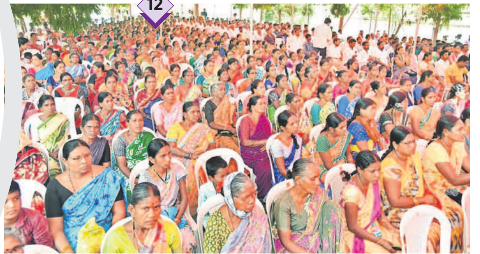
హాజరైన తెలంగాణ రాష్ట్ర గురుకుల పేరెంట్స్ అసోసియేషన్ సభ్యులు

గురుకులాల సంఖ్యను పెంచి మంచి విద్యను అందిస్తున్న ఘనత సీఎం కేసీఆర్ కే దక్కిందని ఆర్థిక, వైద్యారోగ్యశాఖల మంత్రి తనీరు హరీశ్ రావు అన్నారు. సిద్దిపేటలో ఆదివారం నిర్వహించిన తెలంగాణ గురుకుల పేరెంట్స్ ఆశ్చర్య సమ్మేళనంలో ఆయన పాల్గొన్నారు. ఈ సందర్భంగా మాట్లాడుతూ.. ప్రభుత్వ దవాఖానల్లో వసతులు కల్పించి కార్పొరేట్ కు బీటూగా తీర్చిదిద్దామన్నారు. తెలంగాణ ఏర్పడిన తర్వాత మొదటి బిడెండ్ లోనే వ్యవసాయం, కరెంట్, సాగు, తాగునీటి సమస్యలపై దృష్టిసారించి పరిష్కరించినట్లు తెలిపారు. నిరుపేద విద్యార్థులకు కార్పొరేట్ విద్యను అందించేందుకు 290 ఉన్న గురుకులాలను ముఖ్యమంత్రి కేసీఆర్ 1000కి పెంచారని గుర్తుచేశారు. సీఎం తెలంగాణను అన్నపూర్ణగా మార్చారన్నారు. గురుకులాలకు మిషన్ భగీరథ ద్వారా తాగునీరు సరఫరా చేస్తున్నామని చెప్పారు. - సిద్దిపేట, నవంబర్ 19