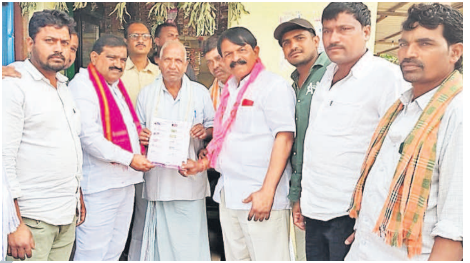
బొంరాస్ పేట: హాకీంపేటలో ప్రచారం చేస్తున్న మంత్రి మహేందర్ రెడ్డి