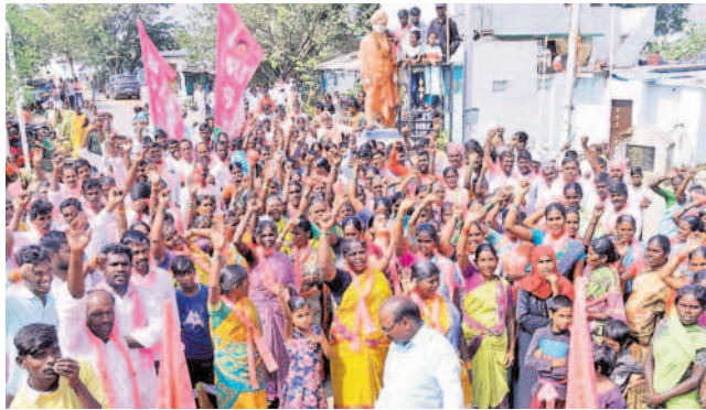
నినాదాలు చేస్తున్న మహిళలు, యువకులు