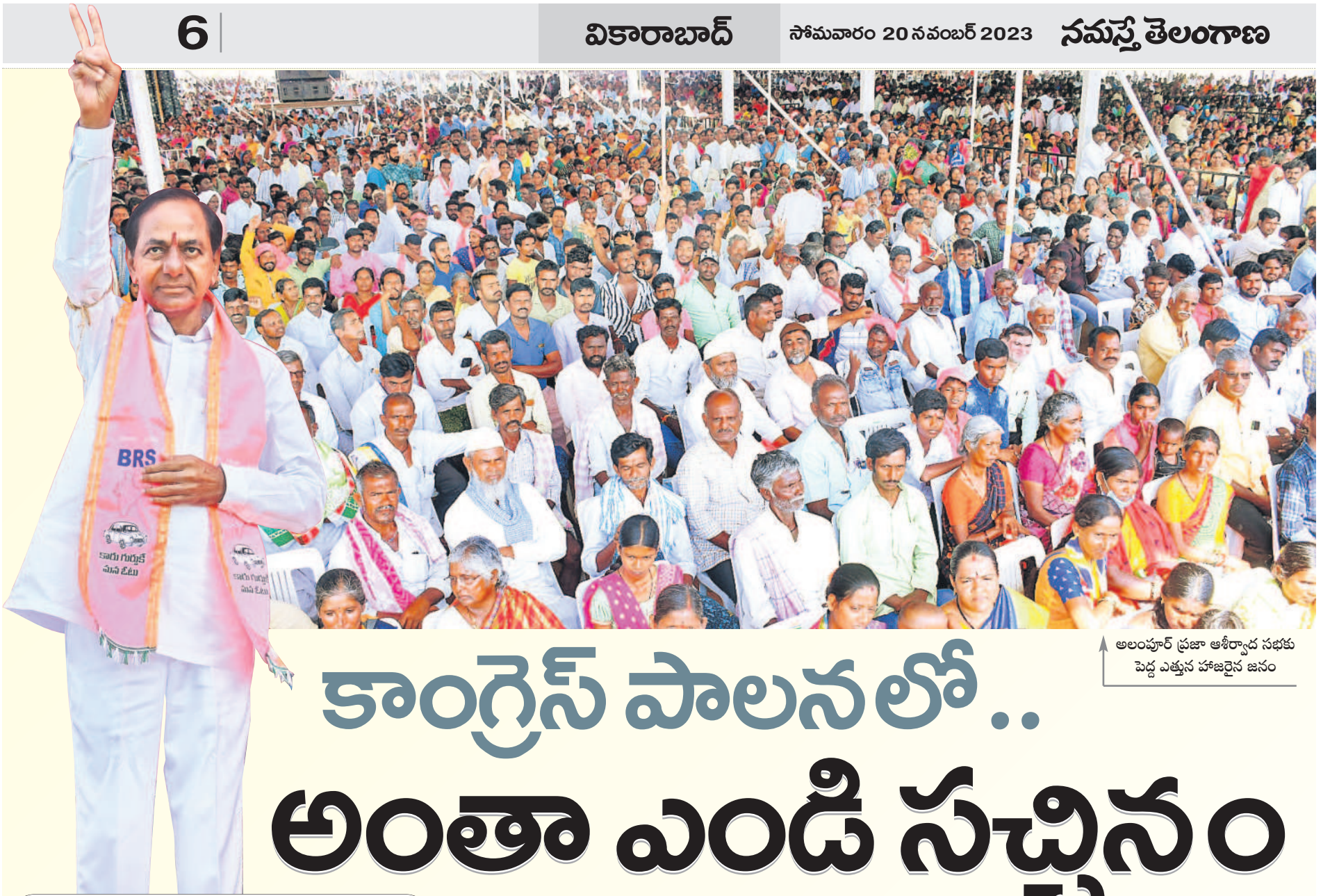
అలంపూర్ ప్రజా ఆశీర్వాద సభకు పెద్ద ఎత్తున హాజరైన జనం