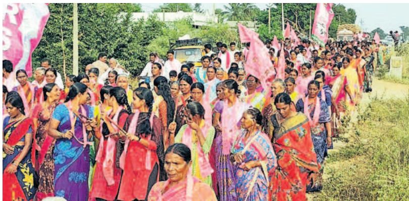
సముద్రాలలో ర్యాలీ నిర్వహిస్తున్న మహిళలు