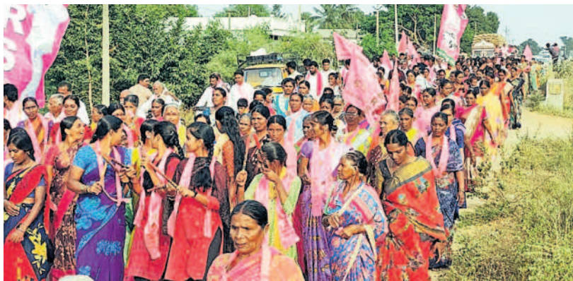
సముద్రాలలో రా్యశీ నిర్వహిస్తున్న మహిళలు