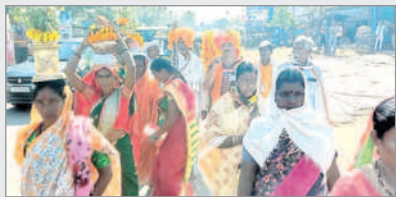
పండలీపూర్కు వెళ్తున్న భక్తులు