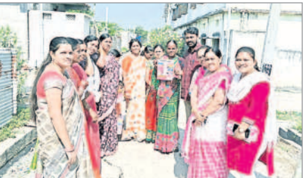
ఎదులాపురం: ప్రచారంలో పాల్గొన్న మహిళలు

జైనద్, నవంబర్ 20: కాంగ్రెస్, బీజేపీ మోసపూరిత మాటలు చెబుతున్నాయని, నమ్మితే అగం చేస్తారని ఆదిలాబాద్ ఎమ్మెల్యే జోగు రామన్న అన్నారు. ఎన్నికల ప్రచారంలో భాగంగా బేల మండలంలో ఎమ్మెల్యే జోగు రామన్న విస్తృత పర్యటన చేశారు. ఇంటింటికి వెళ్లి ఓటర్లను కలిశారు. మొదట గ్రామానికి వచ్చిన ఎమ్మెల్యే జోగు రామన్నకు మంగళహారతులతో స్వాగతం పలికి డప్పు చప్పుళ్ల మధ్య ఘన స్వాగతం పలికారు. ఎమ్మెల్యే జోగు రామన్న మాట్లాడుతూ ప్రజాసానికీ ఎలాంటి సంక్షేమం అందించకుండా 72 ఏళ్లు పాలించిన బీజేపీ, కాంగ్రెస్ ఏ ముఖం పెట్టుకొని గ్రామాల్లో ఓట్లు అడ్డుకొని వస్తారని ఎమ్మెల్యే జోగు రామన్న ధ్వజమెత్తారు. బేల మండలాభివృద్ధిలో భాగంగా ఆదిలాబాద్ పట్టణం నుంచి బేల వరకు రూ.వేల కోట్లు వెచ్చించి రోడ్లు అభివృద్ధి చేయడం జరిగిందని, నాడు నానా అవస్థలు ఎదుర్కొన్న ప్రయాణికులు నేడు సులభతరంగా ప్రయాణాన్ని చేసుకోగలుగుతున్నారన్నారు. కాంగ్రెస్, బీజేపీ నాయకులు రైతుల పట్ల అమానుషంగా ప్రవర్తించారన్నారు. మూడోసారి ముఖ్యమంత్రి కేసీఆర్ ను గెలిపించుకొని ఎమ్మెల్యే అభ్యర్థి జోగు రామన్నను బలపర్చాలని కోరారు. జిల్లా