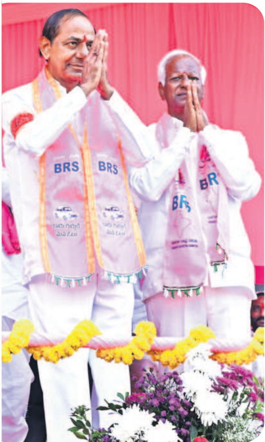
స్టేషన్ ఘనపూర్ సభకు పెద్ద ఎత్తున హాజరైన జనం, ప్రజలకు అభివాదం చేస్తున్న సీఎం కేసీఆర్, అభ్యర్థి కడియం శ్రీహరి