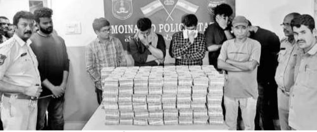
తనఖిల్లో భాగంగా ఇటీవల పోలీసులు స్వాధీనం చేసుకున్న నగదు