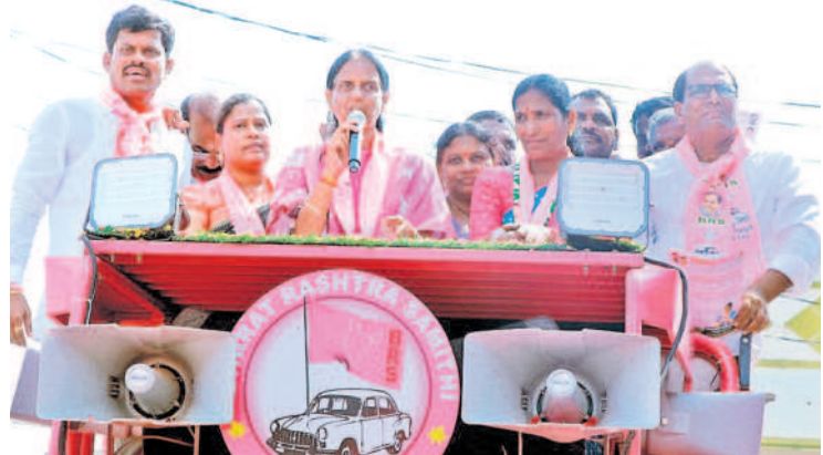
తిమ్మాపూర్ గ్రామంలో మాట్లాడుతున్న సబితా ఇంద్రారెడ్డి

కందుకూరు. నవంబర్ 20: రంగారెడ్డి- పాలమూరు ఎత్తిపోతల పథకం ద్వారా ప్రతి ఎకరాకు సాగునీరుతో పాటు తాగునీరు అందించడానికి కృషి చేస్తానని రాష్ట్ర విద్యాశాఖ మంత్రి సబితా ఇంద్రారెడ్డి తెలిపారు. సోమవారం మండల పరిధిలోని సరస్వతీగూడ, అగర్ మియాగూడ, తిమ్మాపూర్, జబ్బారగూడ, బేగంపేట, రాచులూరు, బైరాగిగూడ, కొత్తూరు గ్రామాల్లో రోడ్ షో నిర్వహించారు. ఈ సందర్భంగా మంత్రి మాట్లాడుతూ.. ఆంజనేయ స్వామి దేవాలయం లేని గ్రామం ఉండదన్నారు. ప్రభుత్వ పథకాలు అందని గడప లేదని చెప్పారు. తాను స్థానికురాలని కాదని బీజేపీ నాయకులు అంటున్నారని, మీ కేంద్ర మంత్రి కిషన్ రెడ్డి స్థానికుడా.. అని ప్రశ్నించారు. కిషన్ రెడ్డి సికింద్రాబాద్ పార్లమెంట్ నుంచి ఎందుకు పోటీ చేశాడో తెలుపాలన్నారు. సీఎం కేసీఆర్ కు కందుకూరు అంటే ప్రేమ ఉన్నదని చెప్పారు. ముచ్చర్ల గేటు వరకు మెట్రోతో పాటు మెడికల్ కళాశాల, 450 పడకల ఆసుపత్రి కావాలంటే తనను గెలిపించాలని కోరారు. కాంగ్రెస్ పార్టీ ఇచ్చే హామీలను నమ్మితే మానపోతారని, కాంగ్రెస్ పార్టీ హ్యానిఫెస్టోను నమ్మవద్దని కోరారు. కాంగ్రెస్ పార్టీ అధికారంలోకి వస్తే రాష్ట్రాన్ని అమ్ముకుంటారని మంత్రి ఎద్దేవ చేశారు. కాంగ్రెస్, బీజేపీ పట్ల ప్రజలు అప్రమత్తంగా ఉండాలని కోరారు. సీఎం కేసీఆర్ ప్రభుత్వమే అధికారంలోకి వస్తుందని, మీ సేవకూ