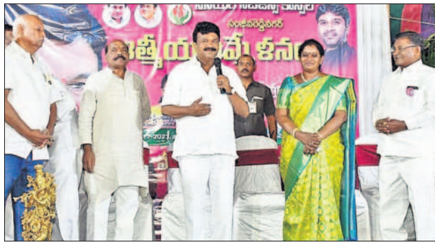
వయోధికుల ఆత్మీయ సమ్మేళనంలో మాట్లాడుతున్న మంత్రి తలసాని, పాల్గొన్న సభ్యులు