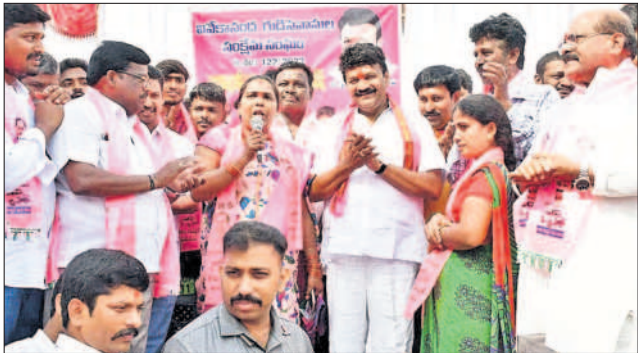
దాసారం హట్స్ వాసుల సమావేశంలో పాల్గొన్న బీఆర్ఎస్ సనత్ నగర్ అభ్యర్థి, మంత్రి తలసాని శ్రీనివాస్ యాదవ్

• బీఆర్ఎస్ అభ్యర్థి, మంత్రి తలసాని శ్రీనివాస్ యాదవ్ • సనత్ నగర్ డివిజన్ లో ముమ్మర పచారం