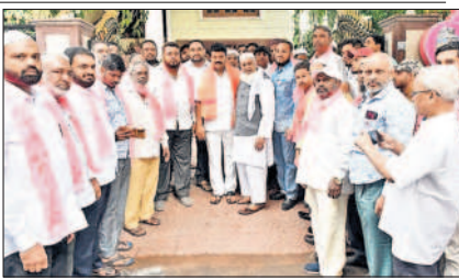
మంత్రి తలసానిని కలిసి మద్దతు తెలుపుతున్న గొర్రెలు, మేకల విక్రయదారులు, మటన్ షాపుల అసోసియేషన్ ప్రతినిధులు