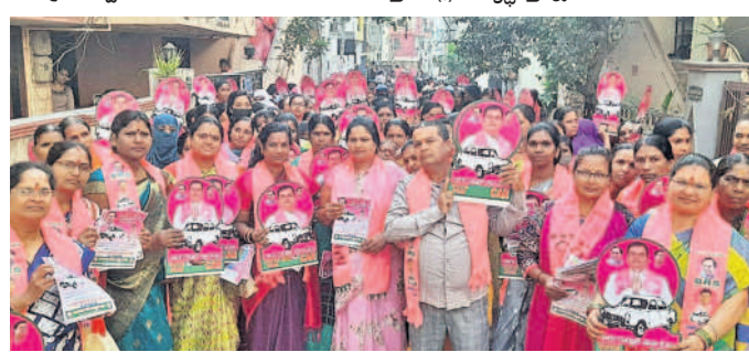
కాలేరును గెలిపించాలని గోల్కాలో ఎన్నికల ప్రచారం నిర్వహిస్తున్న మహిళలు