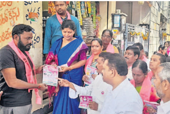
జైస్వాల్ గార్డెన్ లో కాలేరుకు మద్దతుగా ప్రచారం చేస్తున్న కాలేరు పద్మ